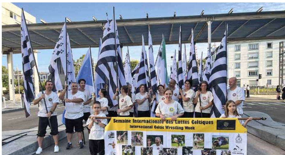
Lors du Festival Interceltique de Lorient 2023. Au premier rang : l'équipe de Saint-Nolff.