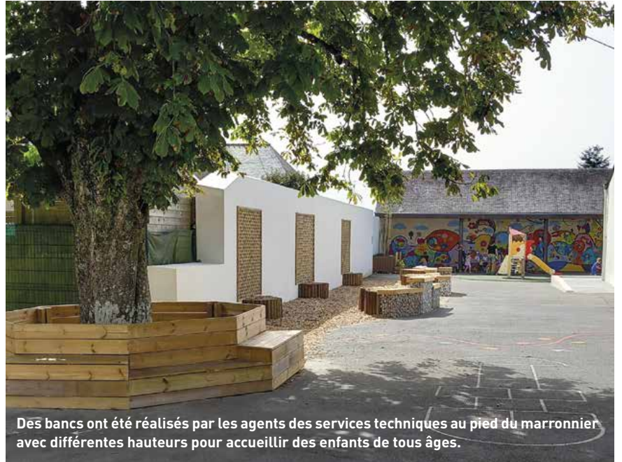
Des bancs ont été réalisés par les agents des services techniques au pied du marronnier avec différentes hauteurs pour accueillir des enfants de tous âges.

L'équipe enseignante a débuté, il y a 2 ans, une réflexion pour réaménager la cour afin d'apporter plus de confort aux enfants et être dans une démarche écologique. Moins de bitume et plus de nature était leur cœur de projet. Les objectifs définis étaient : diminuer la température dans cet espace enclavé de la cour dédiée aux maternelles, offrir des zones ombragées et créer des lieux d'échanges, de convivialité en contact avec la nature.