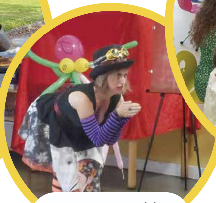
2 spectacles ont été proposés par l'association Big Or Not.