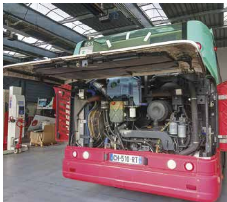
Visite de l'entrepôt où les bus sont entretenus.

En partenariat avec Kicéo (le réseau de bus de GMVA), notre CCAS a proposé le mardi 12 septembre dernier, une sortie à la découverte des transports publics, pour les Séniors qui veulent s'autonomiser dans leurs déplacements.