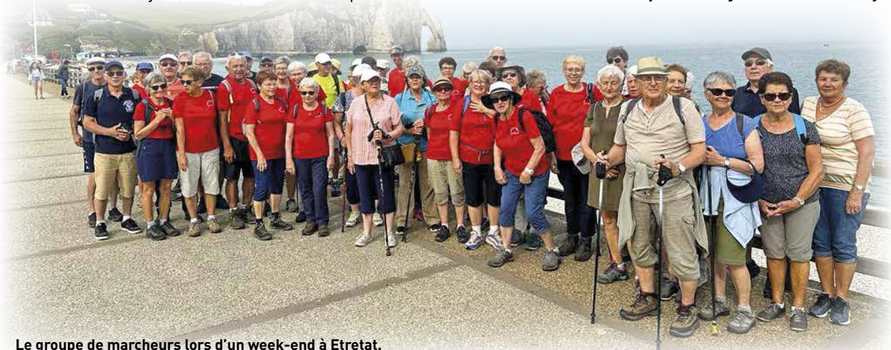
Le groupe de marcheurs lors d'un week-end à Etretat.