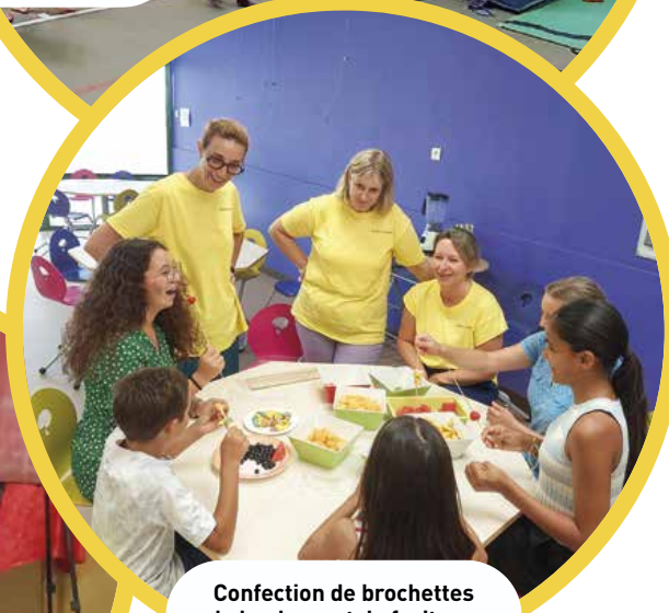
Confection de brochettes de bonbons et de fruits au cours de l'atelier culinaire.