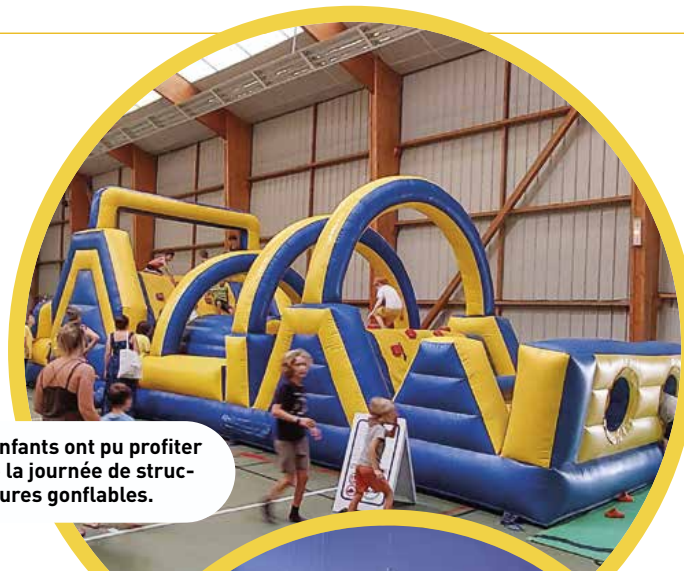
Les enfants ont pu profiter toute la journée de structures gonflables.

Retour en images sur cette journée qui a connu une belle fréquentation et un franc succès.