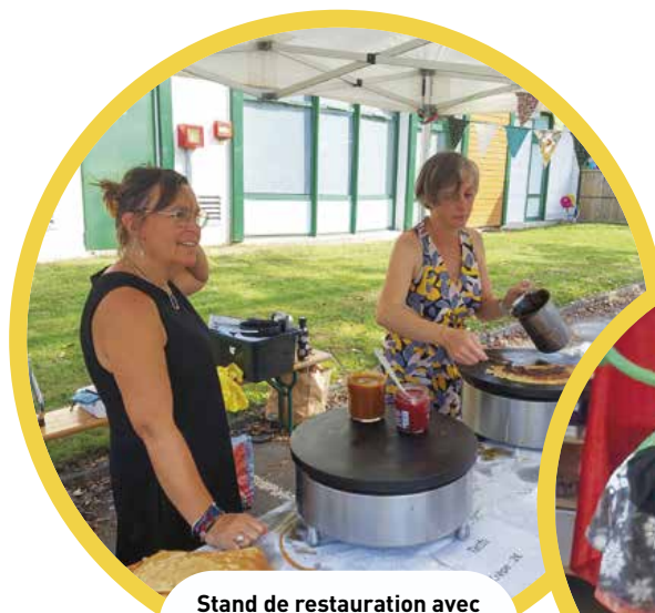
Stand de restauration avec des crêpes «maison» et une buvette.