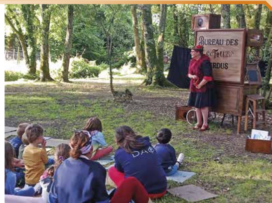
Le Bureau des Lecteurs Perdus par la compagnie Complément d'Objet Insolite.

La compagnie Les Diaboliks a connu un grand succès fin août avec le Grand Machin, le Beau Bidule et l'Incroyable Chose.