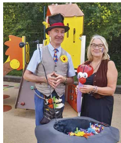
Lors des 20 ans de la Maison de l'Enfant avec M. Hoptabulle.

L'équipe de la Majorité regrette, pour sa part, les absences trop nombreuses et répétées des conseillers municipaux d'opposition à certaines commissions