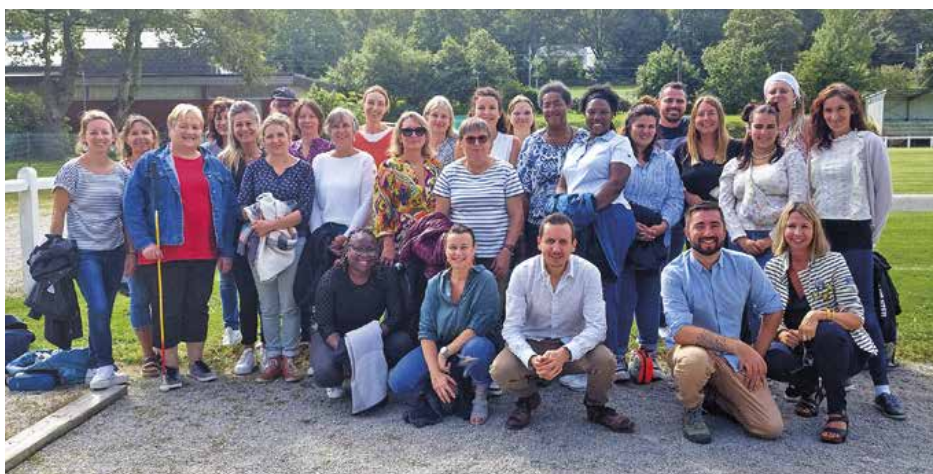
Toute l'équipe s'est retrouvée pour la journée de pré rentrée. Absente sur la photo : Léna Dréano.

Cette journée a permis de préparer la rentrée scolaire dans de bonnes conditions. Les élus à l'enfance et la jeunesse ainsi que le Maire ont participé à la matinée.